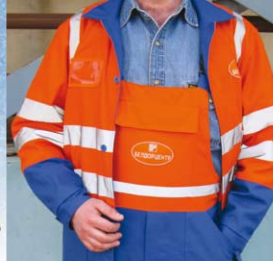
Нанесение на спецодежду

А самое главное – наша компания предлагает вам сэкономить драгоценное время на поиски поставщиков этого чудесного материала. Мы продаем термопленки мирового качества по конкурентно способным ценам сразу от четырех ведущих производителей: «SISER» (Италия), «POLI-TAPE» (Германия), «СНТ» (Германия), «MISCO» (Ю. Корея).